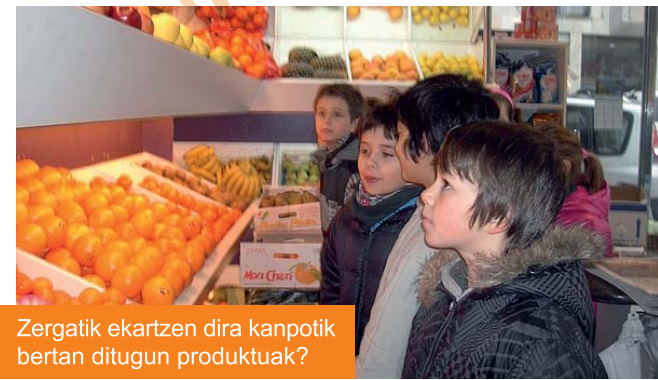
Zergatik ekartzen dira kanpotik bertan ditugun produktuak?

• Lehen Hezkuntzako 3. eta 4. mailakook herriko dendetan garaiko produktuak identifikatu eta jatorri ezberdinak aztertu ditugu.