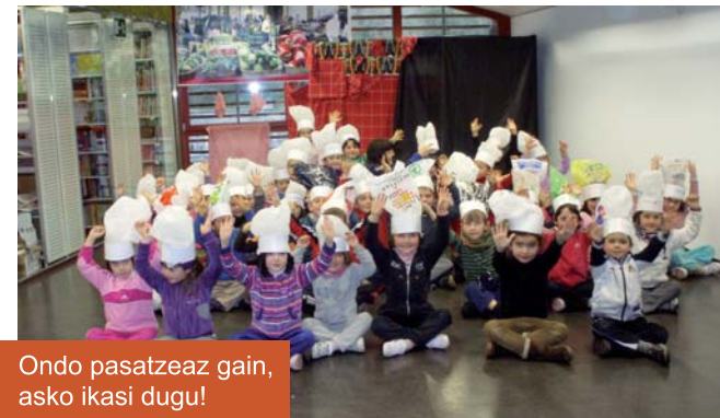
Ondo pasatzeaz gain, asko ikasi dugu!

• Gabonak eta kontsumoa ekintzan txotxongilo saio baten bitartez, azokak eta herriko denda txikiak erabili behar ditugula ikasi dugu, dastamen-tailerra burutu dugu, bertakoak diren 3 produktu asmatu behar izan ditugu eta, azkenik, eskulan tailerrean, sukaldari-txapela egin dugu plastikozko poltsa bat berrerrabiliz.