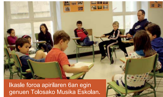
Ikasle foroa apirilaren 6an egin genuen Tolosako Musika Eskolan.

Herriaren diagnosis egin ondoren, udalbatzarrera eraman ditugu ikasleen foroan adostutako emaitzak eta atera ditugun ondorio nagusiak hauek izan dira: