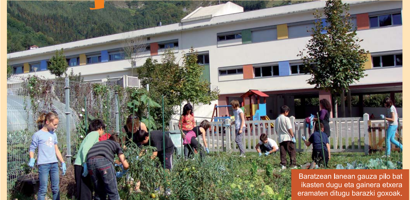
Baratzean lanean gauza pilo bat ikasten dugu eta gainera etxera eramaten ditugu barazki goxoak.

Hauexek dira Udalari egoera hobetzeko egin dizkiogun proposamenak: