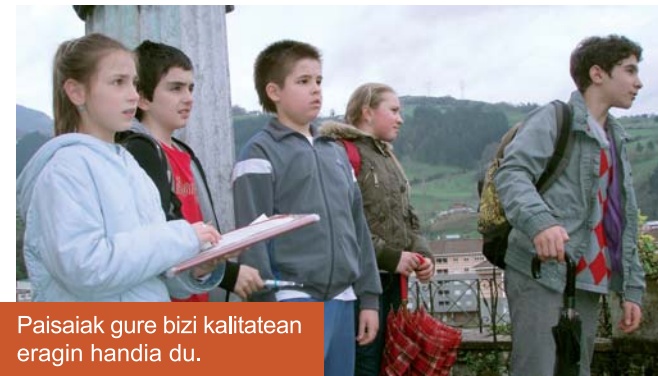
Paisaiak gure bizi kalitatean eragin handia du.

• Lehen Hezkuntzako 5. eta 6. mailakook herritarrei galdetegiak egin diegu eta kontsumo ohiturak aztertu ditugu. Nekazaritza ekologikoa zertan datzan aztertu dugu eta herrian produktu ekologikoak erosteko aukerak aztertu ditugu. Baserriak ondare kultural eta paisajistiko bezala duen garrantzia jabetu gara.