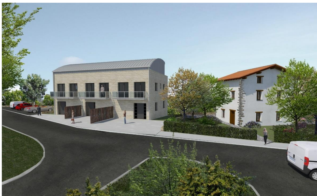
Ortofoto orientativa del conjunto edificatorio

A la vista de que la parcela es el final del barrio de Amarotz y el suelo no urbanizable en el que se sitúa precisamente la Ermita de San Blas, se ha optado por una edificación de baja densidad (a.30 bajo desarrollo)