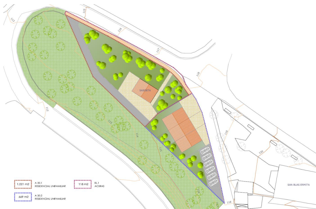
Plano de delimitación del sector y de ordenación

La presente modificación afecta al subámbito 20. Amarotz, pero única y exclusivamente a la zona en la que se ubica el caserío Sasoeta.