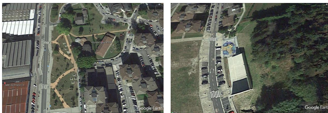
Espacios urbanos de esparcimiento, recreo y deportivos ejecutados en loa última década

Sin embargo y en sentido contrario, podemos recalcar que las zonas de sobre todo tras las reformas realizadas en la última década esparcimiento e integración social de la zona, así como las deportivas y/o de recreo, están diseñadas y ejecutadas desde una perspectiva de igualdad y seguridad de una manera ás que satisfactoria.