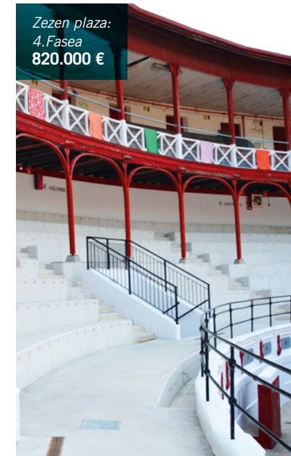
Zezen plaza: 4. Fasea 820.000 €