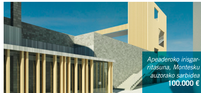
Apeadero irigarritasuna, Montesku aizorako sarbidea 100.000 €