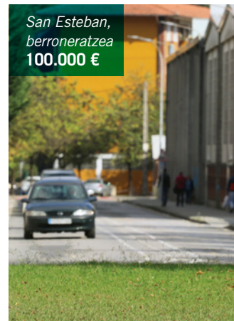
San Esteban, berroneratzea 100.000 €