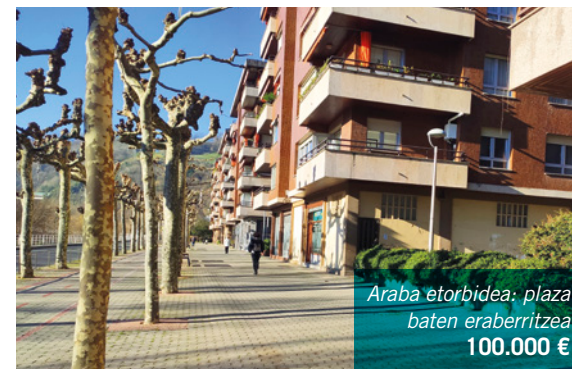
Araba etorbidea: plaza baten eraberritzea 100.000 €