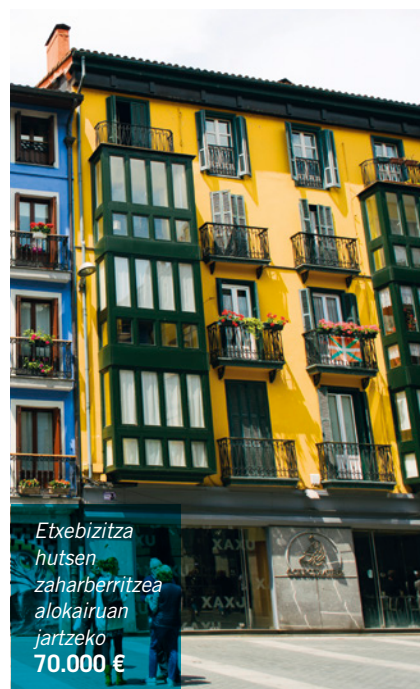
Etxebizitza hutsen zaharberritzea alokairuan jartzeko 70.000 €