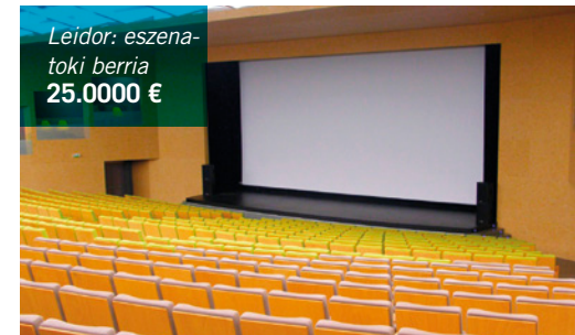
Leidor: eszena- toki berria 25.000 €