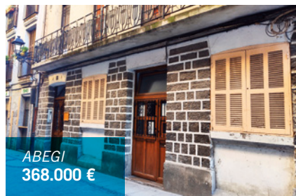
ABEGI 368.000 €