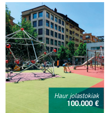
Haur jolastokiak 100.000 €