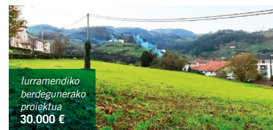
Iurramendiko berdegunerako proiektua 30.000 €

El Ayuntamiento dispondrá de casi 6,6 millones para acometer proyectos de gran calado y seguir trabajando las bases de los proyectos de futuro.