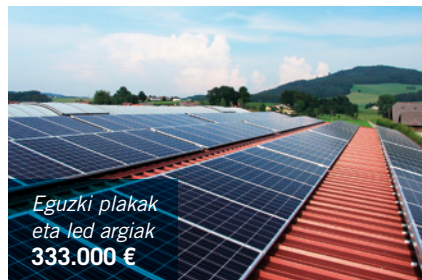
Eguzki plakak eta led argiak 333.000 €