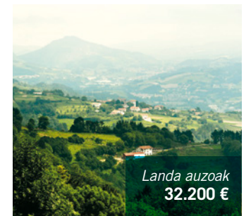
Landa auzoak 32.200 €