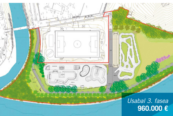
Usabal 3. fasea 960.000 €