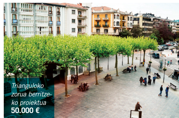
Trianguloko zorua berritze- ko proiektua 50.000 €