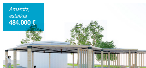
Amarotz, estalkia 484.000 €