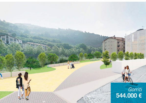
Gorriti 544.000 €