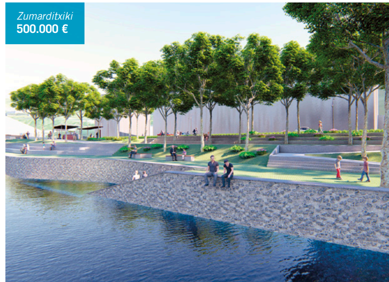
Zumarditxiki 500.000 €