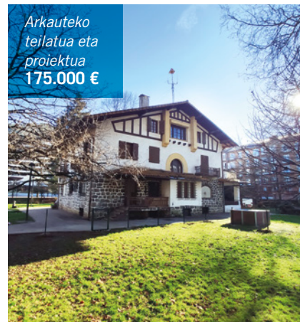
Arkauteko teilatua eta proiektua 175.000 €