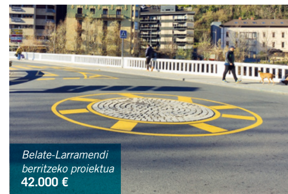
Belate-Larramendi berritze ko proiektua 42.000 €