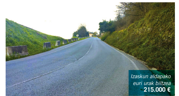
Izaskun aldapako euri urak biltzea 215.000 €