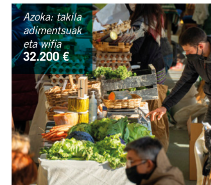
Azoka: takila adimentsuak eta wifia 32.200 €